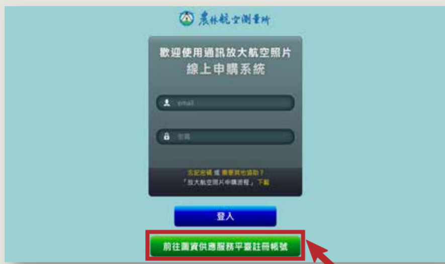
▲放大航空照片線上申購系統

至放大航空照片線上申購系統： https://gis.afasi.gov.tw/atiscomm/member/login 點選前往圖資供應服務平臺註冊帳號。