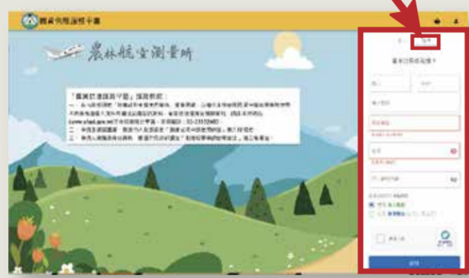
▲新視窗(圖資供應服務平臺)